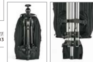
3タイプとも三脚を装着可 プロとハードドライブは三脚保持カップ付属

市街地を目立たずに移動し、取材現場では素早く機材を取り出せるバックパック・シリーズ。70-200mm F2.8 のズームを装着した DSLR ボディを収納できる「ストリート・ウォーカー」、500mm F4 を収納できる同「プロ」、そして 15.4 インチまでの PC を収納できるスペースが用意した同「ハードドライブ」の 3 モデルからお選びいただけます。プロとハードドライブには三脚保持カップが付属、さらにプロとハードドライブは別売のプロスピードベルトが装着可能です。