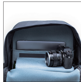
コンパートメント上部の仕切り