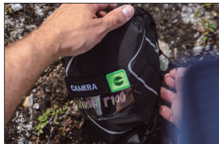
パッチ (別売) 使用イメージ